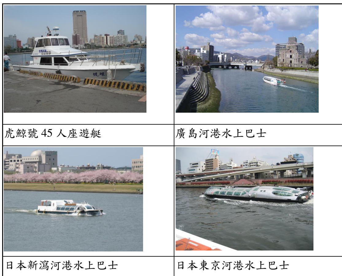
圖 3 其他城市遊艇及水上巴士

(9)導覽設備：需具有 LCD 螢幕及放映廣播設備，除播放救生設備使用及沿線導覽影片（雙語）。