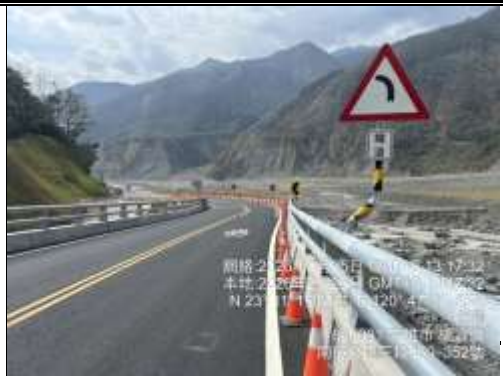
已於2月26日下坡彎道請減速慢行標誌。