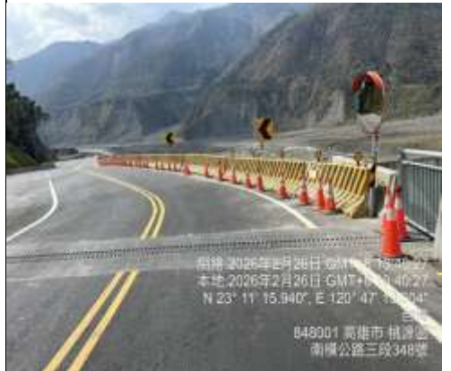
已於3月9日西向東增設右彎標誌完成