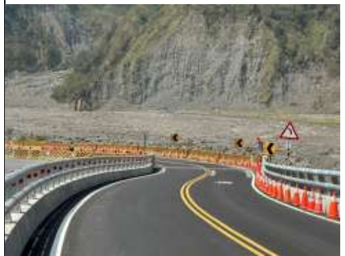
已於2月26日靠河床側增設反光鏡完成。